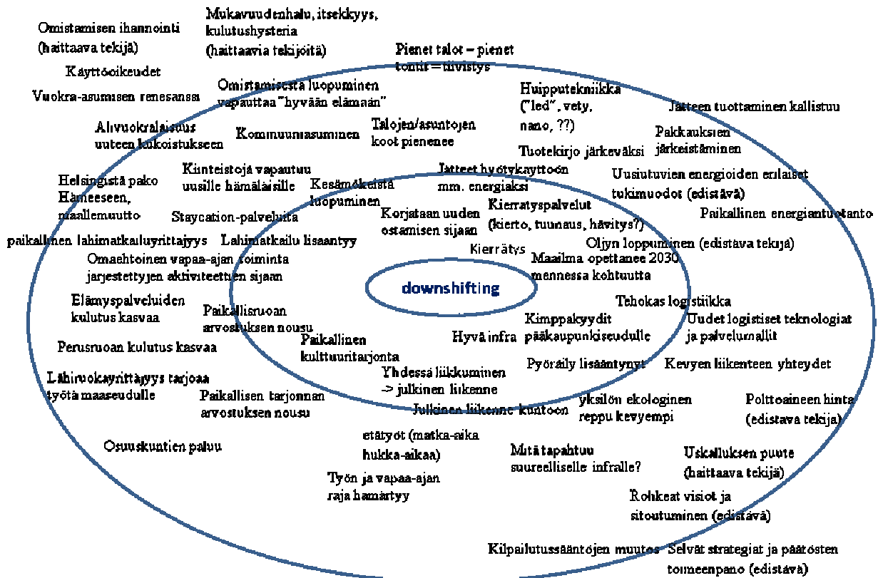
Kuva 2. Downshifting Hämeen tulevaisuuden kannalta.