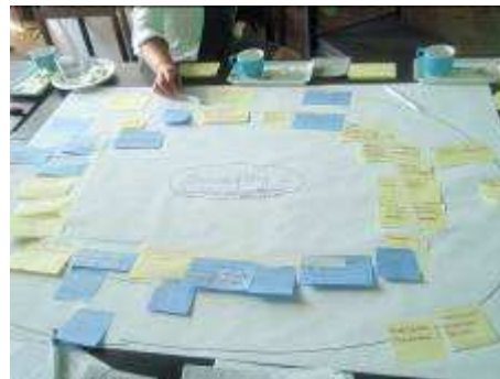
Kuva 1. Tulevaisuusverstaassa ideoitiin aktiivisesti Hämeen tulevaisuutta.