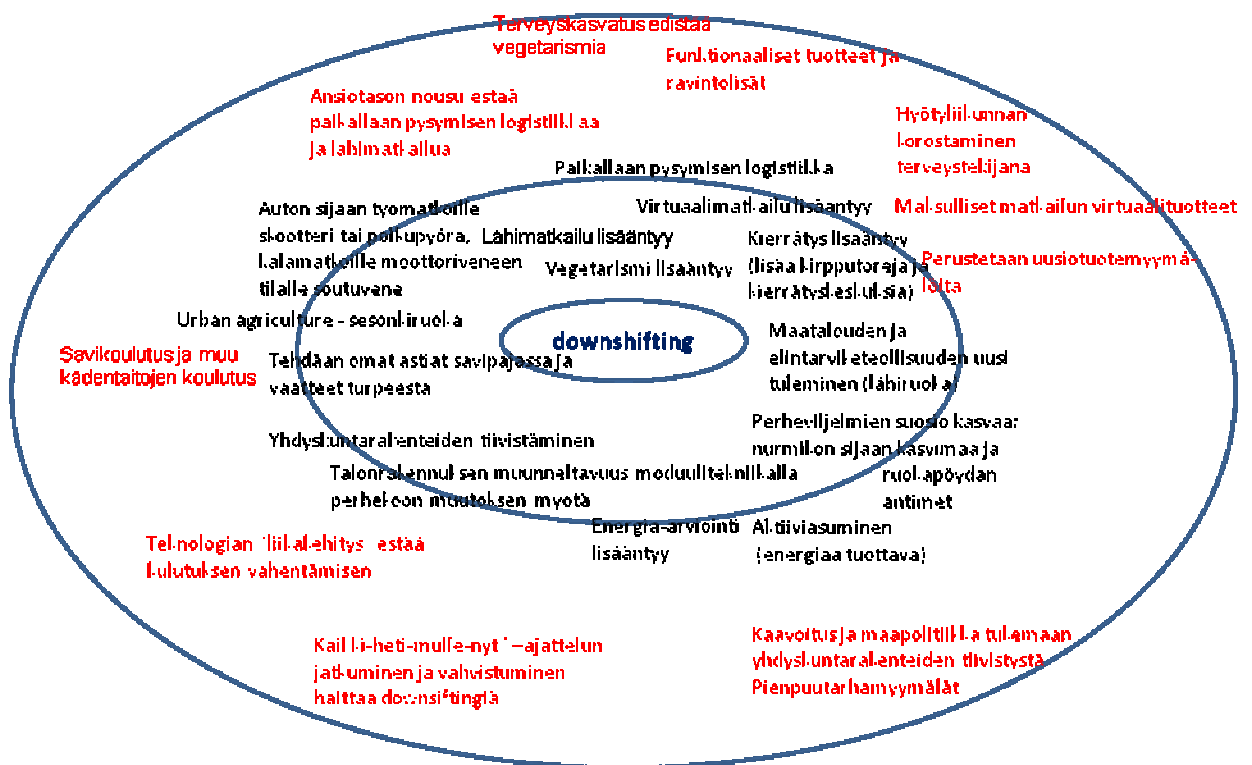
Kuva 4. Downshifting Hämeen tulevaisuuden kannalta.