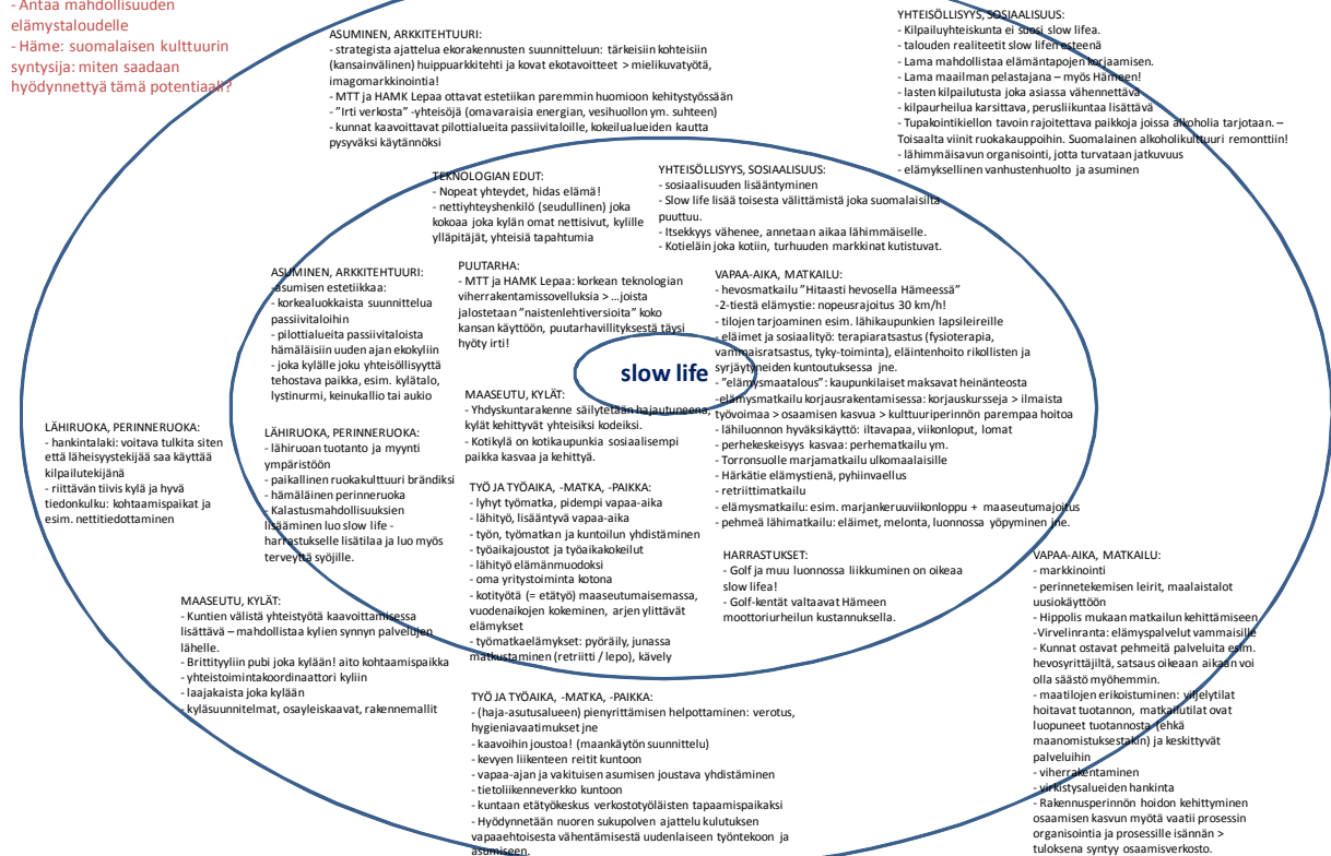
Kuva 5. Slow life Hämeen tulevaisuuden kannalta.

Mielenkiintoista oli havaita, että kolmessa ryhmässä työstettäväksi valikoitui sama orastava ilmiö eli downshifting, joka tarkoittaa kulutuksen vapaaehtoisesta vähentämistä. Tämä voi johtua toisaalta siitä, että kyseinen nouseva ilmiö on todella laajalti kiinnostusta herättävä. Toisaalta se voi osittain johtua siitä, että heikkojen signaalien listalla oli muutama toistaiseksi varsin marginaalinen ilmiö kuten esimerkiksi vertikaaliviljely ja keinolihan kehittäminen. Lisäksi on huomattava, että yksi ryhmä valitsi työstettäväkseen slow lifen eli hitauden vallankumouksen, joka osaltaan kytkeytyy myös downshifting-ilmioon. Näin ollen voidaan vetää se johtopäätös, että Hämeen tulevaisuuden kannalta downshifting ja slow life – kulutuksen vapaaehtoinen vähentäminen ja hitauden vallankumous – ovat vakavasti otettava huomioon strategisessa suunnittelutyössä ja etsittävä väyliä niiden toteuttamiseen.