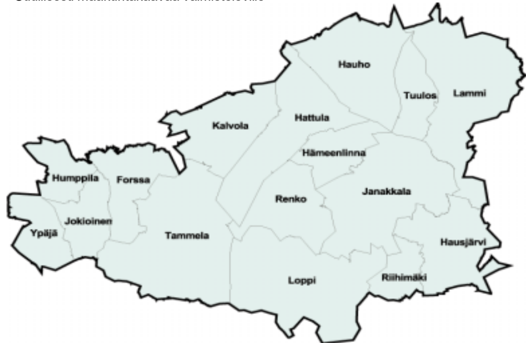
Hämeen liiton toimialue, sen kunnat ja maakuntakaavan suunnittelualue.