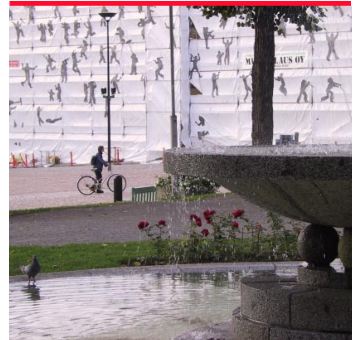
Jokaisella on oikeus vaikuttaa yhteistä ympäristöä koskevaan suunnitteluun ja päätöksentekoon. Kuvassa Hämeenlinnan kuvataidekoulun teos Hämeenlinnan torilla Euroopan rakennusperintöpäivänä syyskuussa 2001.

Kanta-Hämeen maakuntakaavan laatii Hämeen liitto vuosina 2000-2004. Tänä aikana Hämeen liitto julkaisee kaavan valmistelusta kertovaa Maakuntakaavatiedotetta, aina kun jotakin tärkeää on meneillään. Maakuntakaavatiedote 3 on maakunnallisten alueidenkäyttötavoitteiden keskusteluaineisto, jota käytetään mm. seutukunnittaisissa tiedotus- ja keskustelutilaisuuksissa maaliskuussa 2002. Maakuntakaavatiedotetta saa Hämeen liitosta ja sen kunnista. Se on luettavissa Hämeen liiton kotisivuilla ja Maakuntakaavakansiossa, joka on selailtavissa Hämeen liitossa ja sen kaikkien kuntien kunnanvirastoissa. Halukkaat voivat liittyä Maakuntakaavatiedotteen postituslistalle ilmoittamalla sähköpostiosoitteensa tai postiosoitteensa Hämeen liittoon ( maakuntakaava.palaute@hameenliitto.fi , fax. 03 - 6474026, puh. 03 - 647401), tunnuksella "Maakuntakaavatiedotteen postituslista".