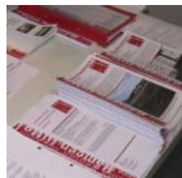
Keskustelu maakuntakaavan tavoitteista käynnistyi keväällä 2002 seutukunnittaisissa tilaisuuksissa ja maakuntavaltuuston seminaarissa.

Tämän Maakuntakaavatiedotteen lisäksi tavoitteet ovat luettavissa Hämeen liiton Internet-sivuilla www.hameenliitto.fi/aluesuunnittelu/maakuntakaavaselostus . Myöhemmin syksyllä ne julkaistaan myös osana Maakuntakaavan lähtökohdat ja tavoitteet -raporttia. Lisätietoja tavoitteista antaa aluesuunnittelupäällikkö Hannu Raittinen, puh. (03) 647 4038.