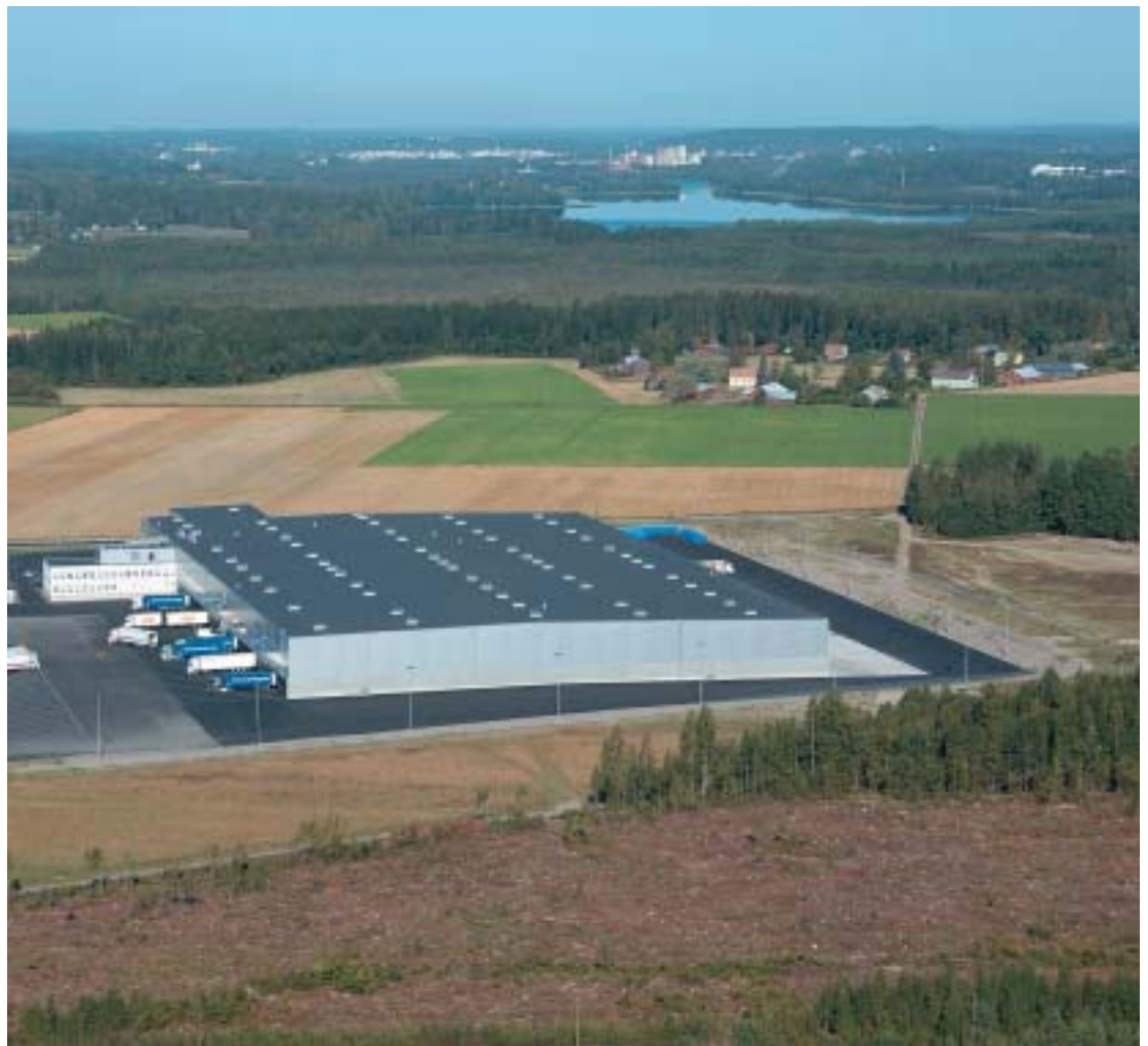
Maakuntakaava littää maankäytön suunnittelun maakunnan muuhun kehittämiseen. Pää tavoitteiden mukaisesti sovitetaan yhteen asumisen, elinkeinojen ja vapaa-ajan tarpeita. Kansainvälisen kauppaketjun uusi jakelukeskus Janakkalassa.

Kanta-Hämeen maakuntakaavan laatii Hämeen liitto vuosina 2000-2004. Tänä aikana Hämeen liitto julkaisee kaavan valmistelusta kertovaa Maakuntakaavatiedotetta, aina kun jotakin tärkeää on meneillään. Maakuntakaavatiedote 4 sisältää kokonaisuudessaan maakuntahallituksen hyväksymät maakuntakaavan tavoitteet sekä tietoa meneillään olevista maakuntakaavan lisäselvityksistä ja ensi kevään nähtävilläolosta. Maakuntakaavatiedotetta saa Hämeen liitosta ja sen kunnista. Se on luettavissa Hämeen liiton kotisivuilla ja Maakuntakaavakansiossa, joka on selailtavissa Hämeen liitossa ja sen kaikkien kuntien kunnanvirastoissa. Halukkaat voivat liittyä Maakuntakaavatiedotteen postituslistalle ilmoittamalla sähköpostiosoitteensa tai postiosoitteensa Hämeen liittoon ( maakuntakaava.palaute@hameenliitto.fi , fax. 03 - 6474026, puh. 03 - 647401), tunnuksella "Maakuntakaavatiedotteen postituslista".